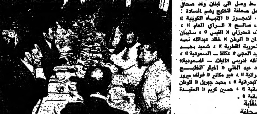
وفد الصحافة الخليجية يزور لبنان بدعوة من طياران الشرق الاوسط